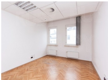
Praha 1 | Na Příkopě