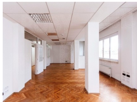
Praha 1 | Na Příkopě