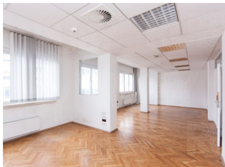
Praha 1 | Na Příkopě