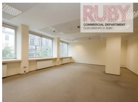
Praha 1 | Na Příkopě