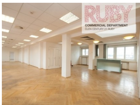
Praha 1 | Na Příkopě