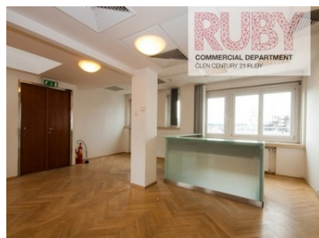
Praha 1 | Na Příkopě