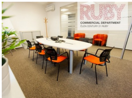
Praha 1 | Revoluční