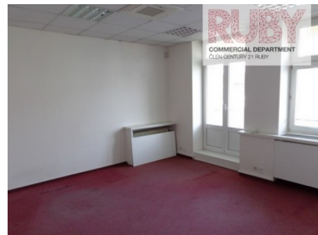
Praha 1 | Revoluční