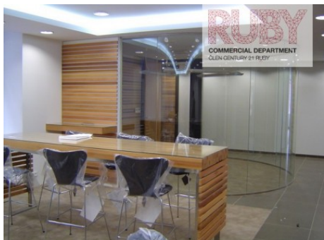
Praha 1 | Revoluční