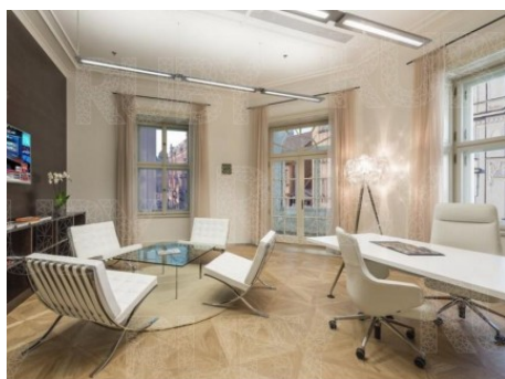
Praha 1 | Jindřišská