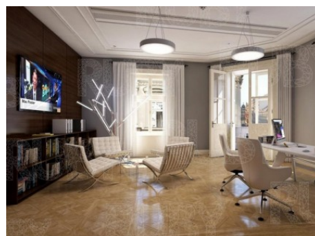
Praha 1 | Jindřišská