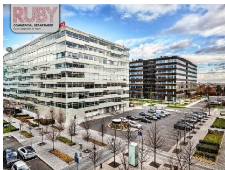
Praha 4 | Vyskočilova