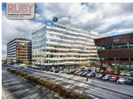
Praha 4 | Vyskočilova